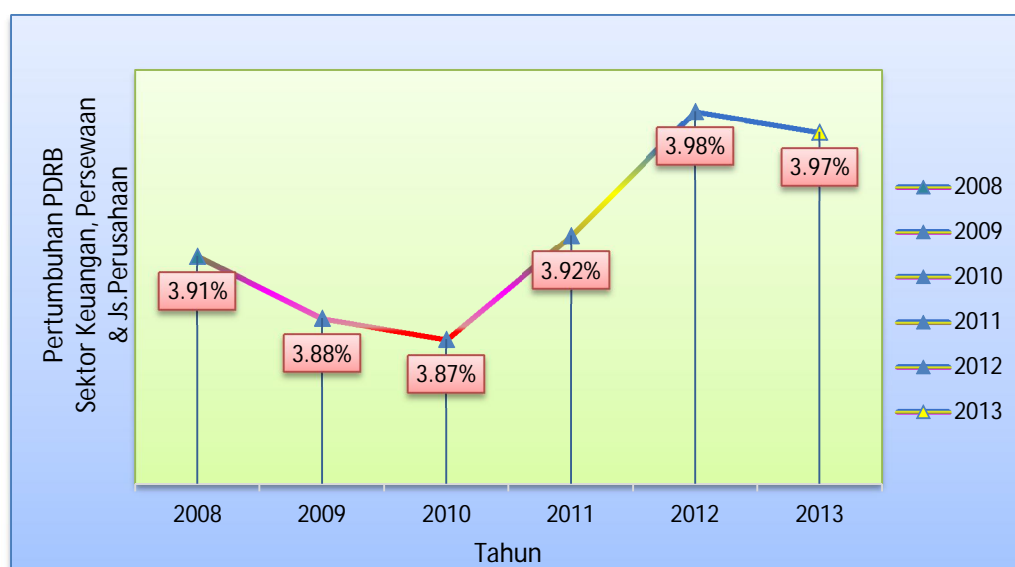
Gambar 3.12. Peran Sektor Keuangan, Persewaan, dan Jasa Perusahaan Berdasarkan PDRB Harga Berlaku Kabupaten Bengkulu Utara Tahun 2008-2013