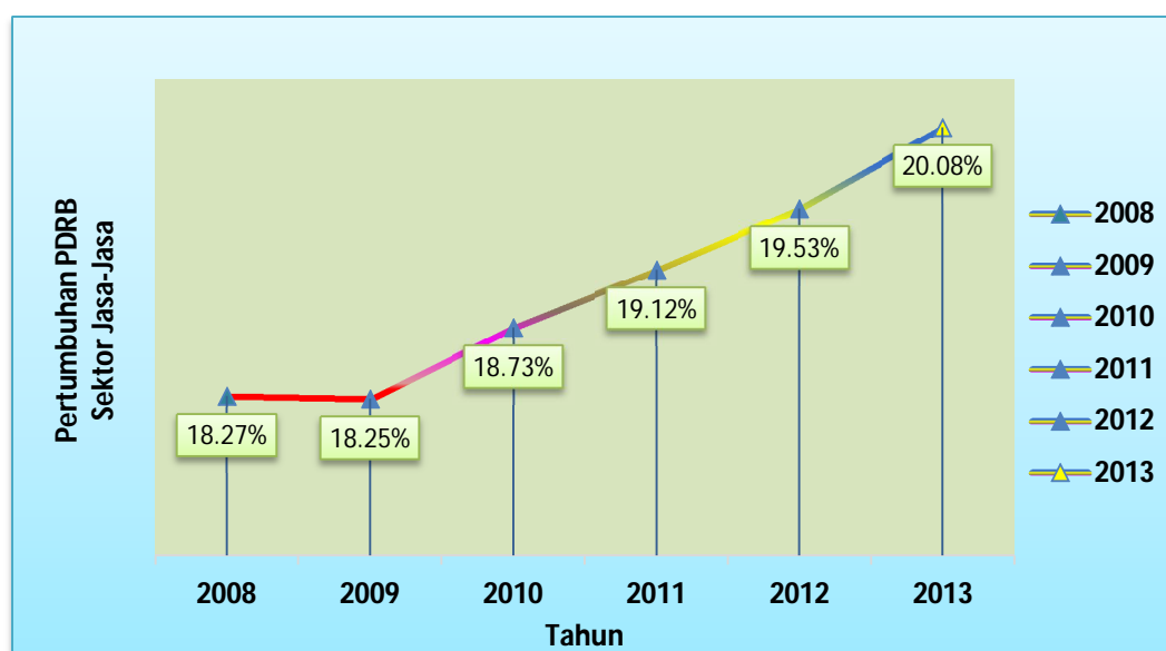
Gambar 3.13. Peran Sektor Jasa-Jasa Berdasarkan PDRB Harga Berlaku Kabupaten Bengkulu Utara Tahun 2008-2012